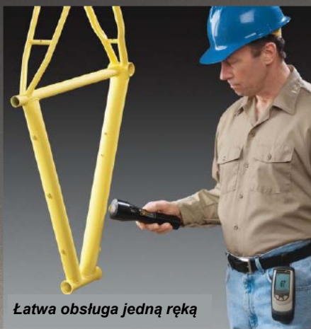
Łatwa obsługa jedną ręką

Bezdotykowy miernik grubości nieutwardzonego proszku