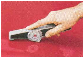
Pomiar na lakierowanej powierzchni

*dotyczy standardów ElektroPhysik pomiaru grubości powłoki **stal: St 33 do St 60 ***specjalne wykonanie (Typ 5=wykonanie standardowe Typ 6 wykonanie automatyczne)